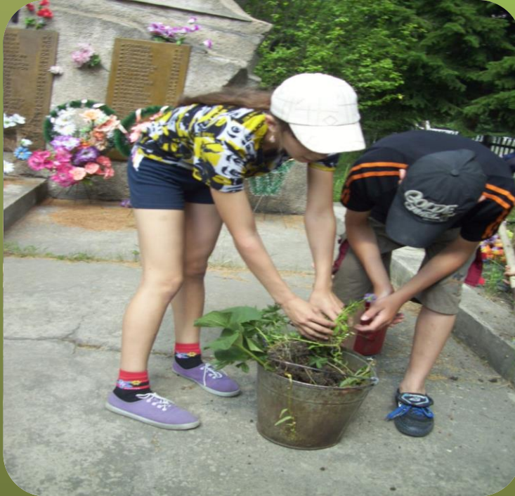
Операция «Мы помним!»