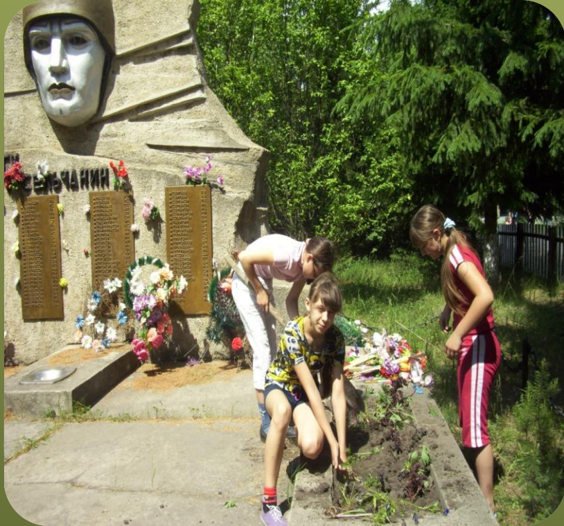
Операция «Благодарность ветерану»