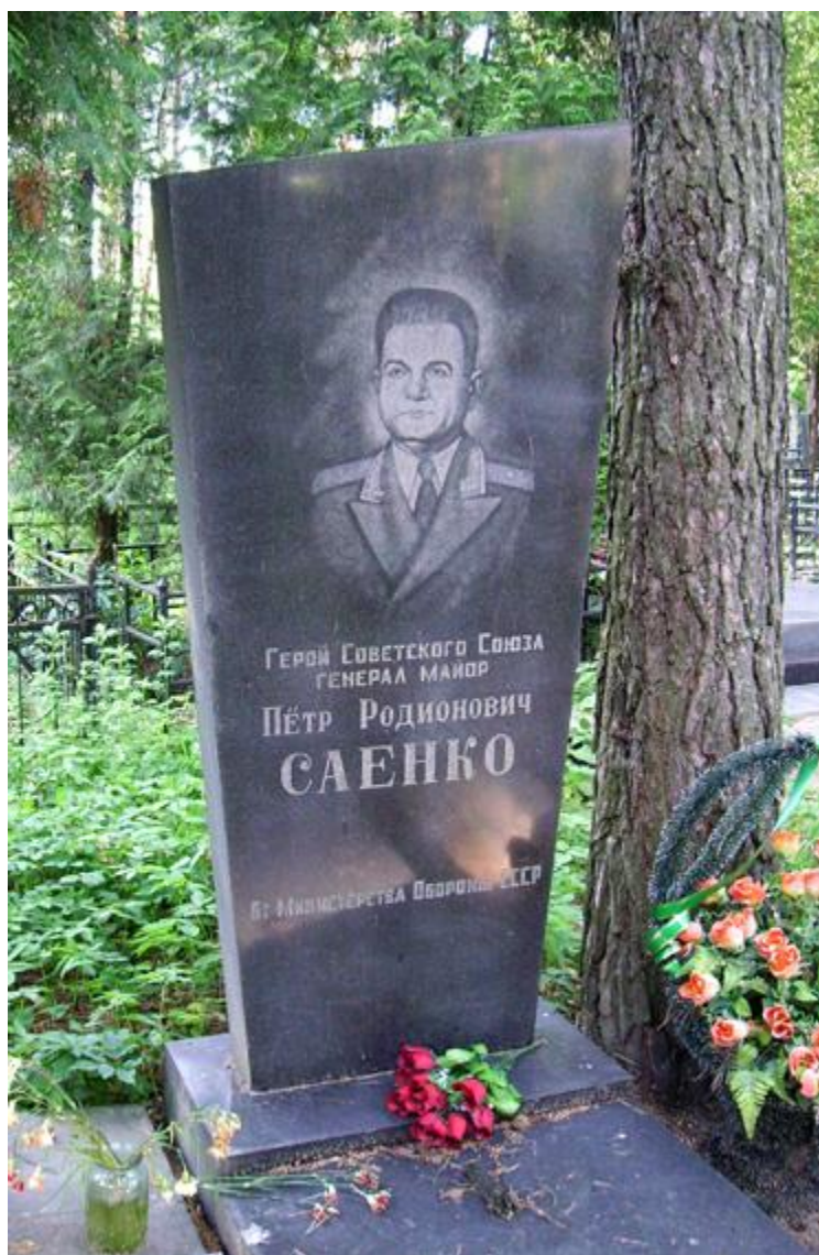
ВОСТОЧНОЕ (МОСКОВСКОЕ) КЛАДБИЩЕ, г. МИНСК, БЕЛОРУССИЯ