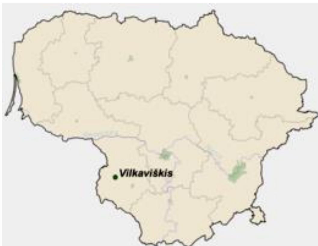
КАРТА ЛИТВЫ, МЕСТЕЧКА ВИЛКАВИШКИС