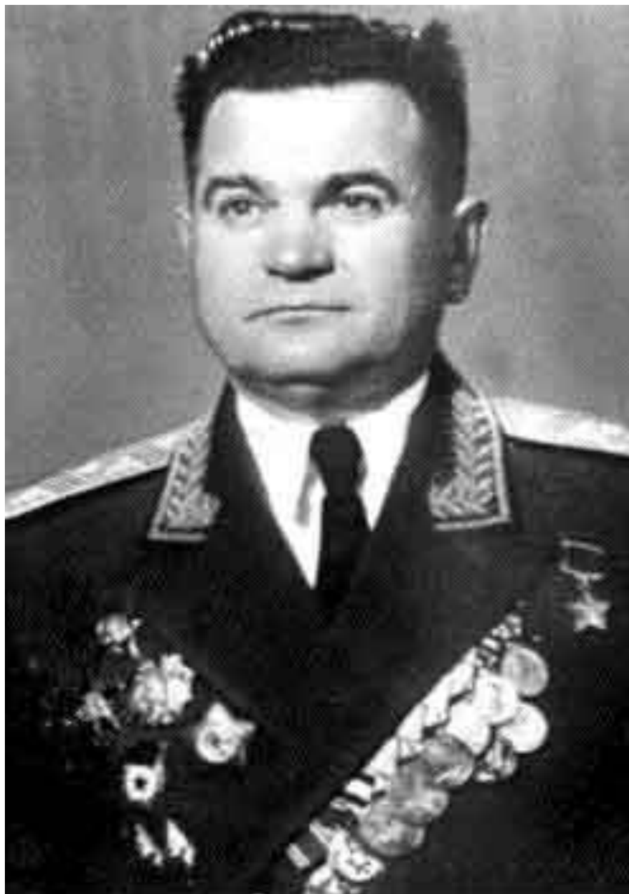
ГЕРОЙ СОВЕТСКОГО СОЮЗА ПЕТР РОДИОНОВИЧ САЕНКО