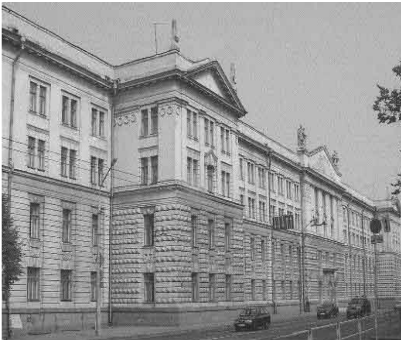
ЗДАНИЕ МИНСКОГО СУВОРОВСКОГО ВОЕННОГО УЧИЛИЩА